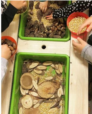
Peuters hebben plezier met hun nieuwe voelbak.