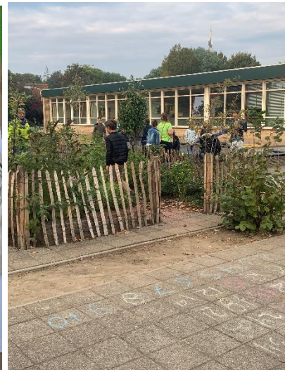
Samen Mocktails maken met ook oogst uit ons eigen voedselbos.