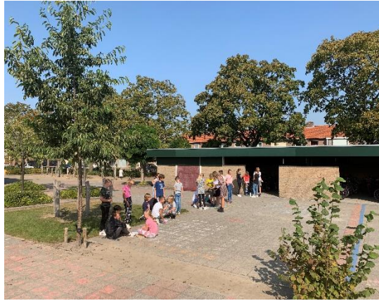
Buitenles taal ontleden met groep 7