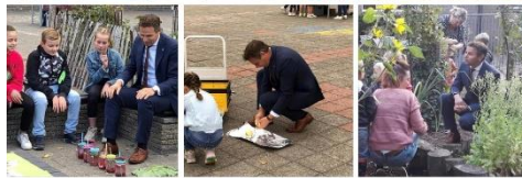
Hoog bezoek bij een les van groep 7 en de moestuin bij de peuters.