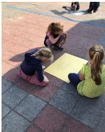
Buiten leren met groep 4, samen een woordweb maken.