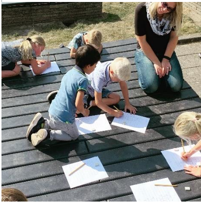
Woordjes zoeken, lezen en schrijven lekker in de buitenlucht met groep 3.