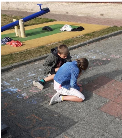
Rekenen in de buitenlucht met groep 5.