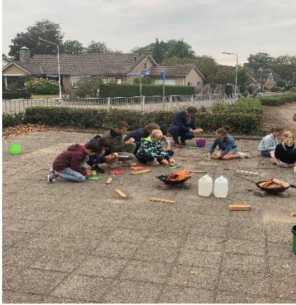
Appels stoven in groep 7