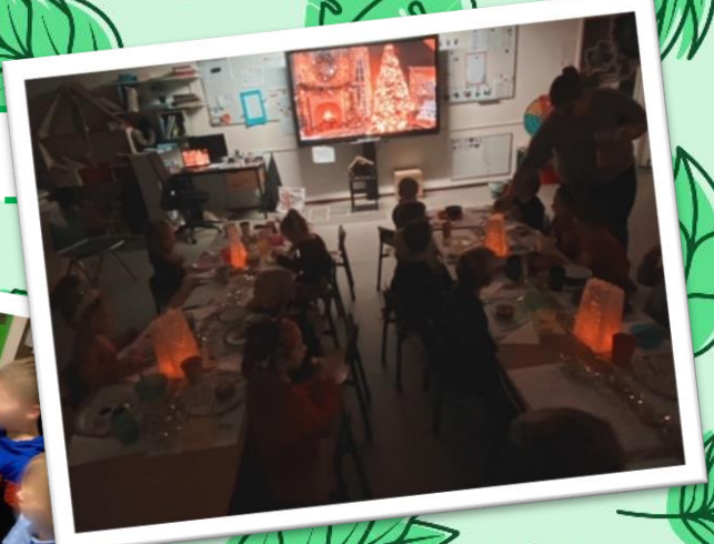
Bedankt Karwei voor het sponsoren van de bomen voor onze kerstviering!