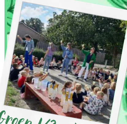
Groep 1/2a, b en c

We maken er een mooi schooljaar van met zijn allen!